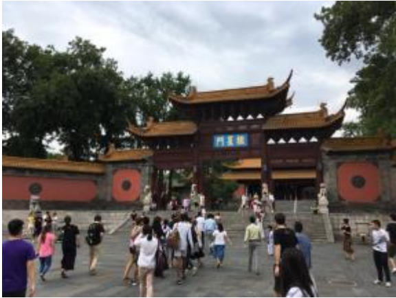
Nanjing Municipal Museum

sommes montés à la tour Yuejiang qui offre une superbe vue sur la ville. On a enfin pu voir le Nanjing Anti-Japanese Aviation Martyrs' Memorial Hall consacré au massacre de 1937.