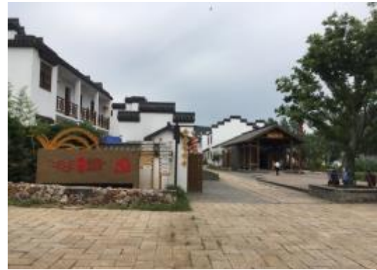
Visite du Huashu Village