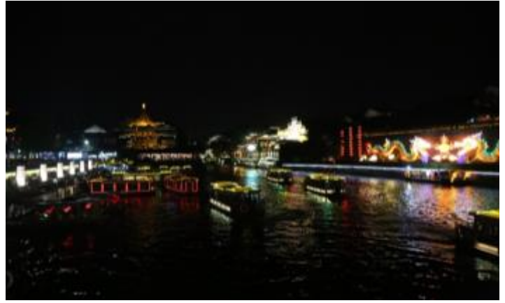
Croisière sur la rivière Qinhuai