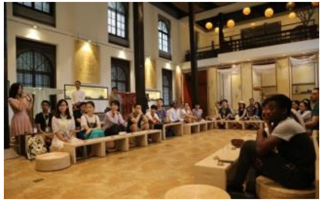
Cérémonie du thé et arts martiaux