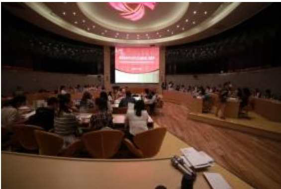
Visite et échange chez Sanpower

Un autre jour, on a eu plusieurs interventions de créateurs d'entreprises partageant leur expérience et nous délivrant de précieux conseils.