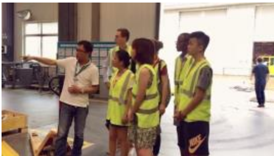
Visite de l'usine

J'ai pu découvrir comment une entreprise occidentale, et plus particulièrement une entreprise suédoise, pouvait s'implanter en Chine, comment elle pouvait s'adapter à la culture chinoise et aux différences, comment ils pouvaient s'en enrichir. J'ai aimé voir le point de vue des occidentaux sur certaines particularités chinoises : sécurité, comment les Chinois travaillent, comment ils se comportent dans l'entreprise, comment ils reçoivent la culture occidentale, comment ils pensent, ... C'était aussi intéressant de voir comment l'entreprise faisait face à certains défis comme le fait de devoir gérer des cycles de ventes, de devoir aussi choisir la bonne technologie. La deuxième partie du stage, nous avons été divisés en 3 groupes de 2 pour approfondir un peu plus un département (R&D, Marketing, Ressources Humaines). J'étais avec l'ingénieur R&D. Il nous a présenté son travail et son rôle dans l'entreprise. On a pu pas mal discuter sur son métier, comment il faisait pour résoudre des problèmes. Il nous a montré des documents et des rapports qu'il avait faits et il nous a