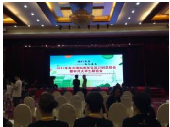
Cérémonie et diner de clôture