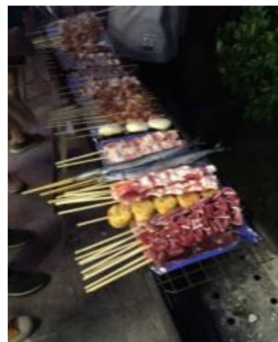
Barbecue dans la campagne chinoise