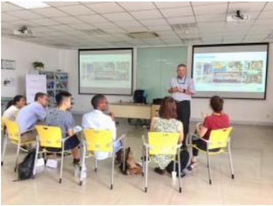
Présentation des managers