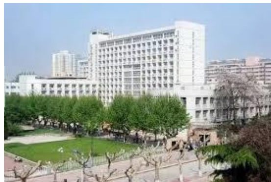
Ancien Campus (Youyi)