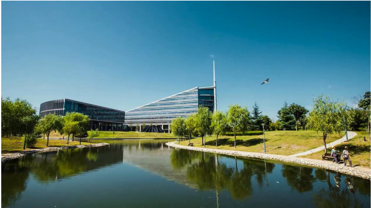
Nouveau Campus (Chang'an)

Si vous choisissez d'habiter sur l'ancien campus, des navettes sont prévues à heures régulières tous les jours (navette payante, environ 2 euros par trajet).