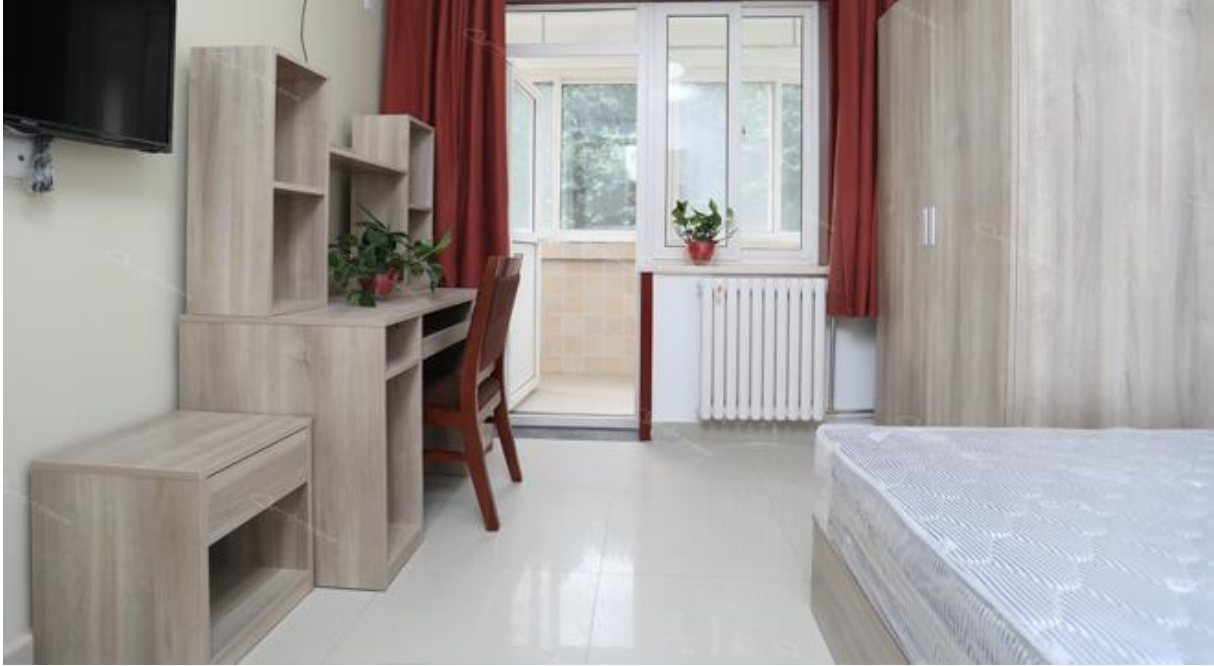
Chambre classique du dortoir T3, une des deux chambres a une véranda pour faire sécher ses vêtements

Concernant les dortoirs, ceux-ci ont un couvre-feu : plus le droit de sortir ou entrer dans le dortoir après minuit, réouverture à 6h du matin.